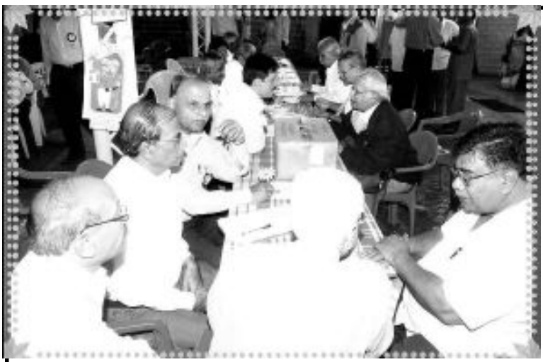
Registration counter at the Annual General Meeting held on 22 nd July 2009 at Ahmednagar